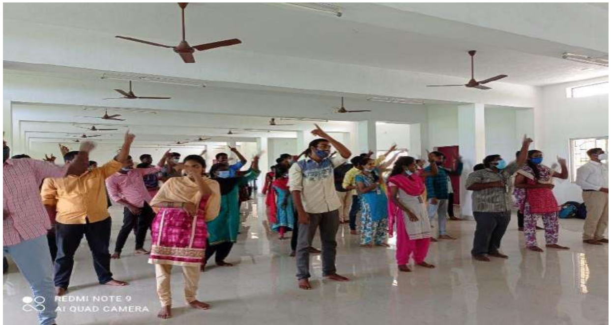
Learning folk dance during Street Theatre Training Programme